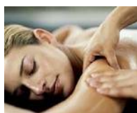
?un dolce massaggio?

Un massaggio rilassante o una doccia tiepida predispongono al relax.